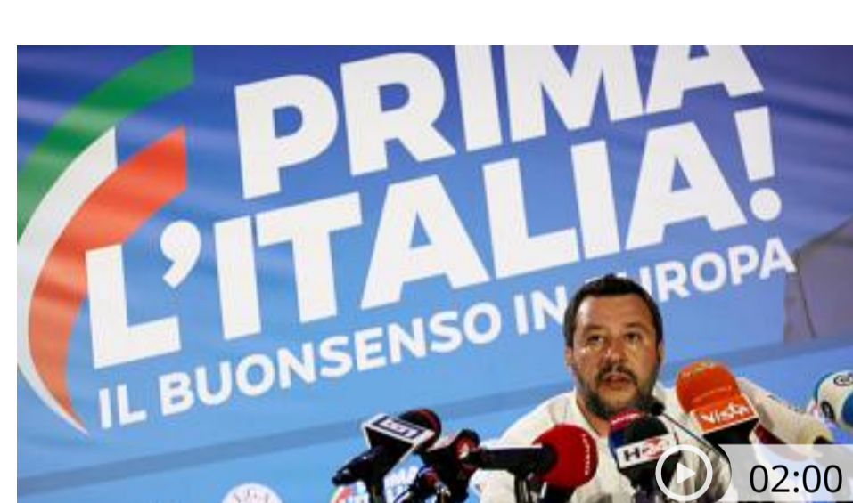
ITALIA Festeggiano Salvini e Zingaretti