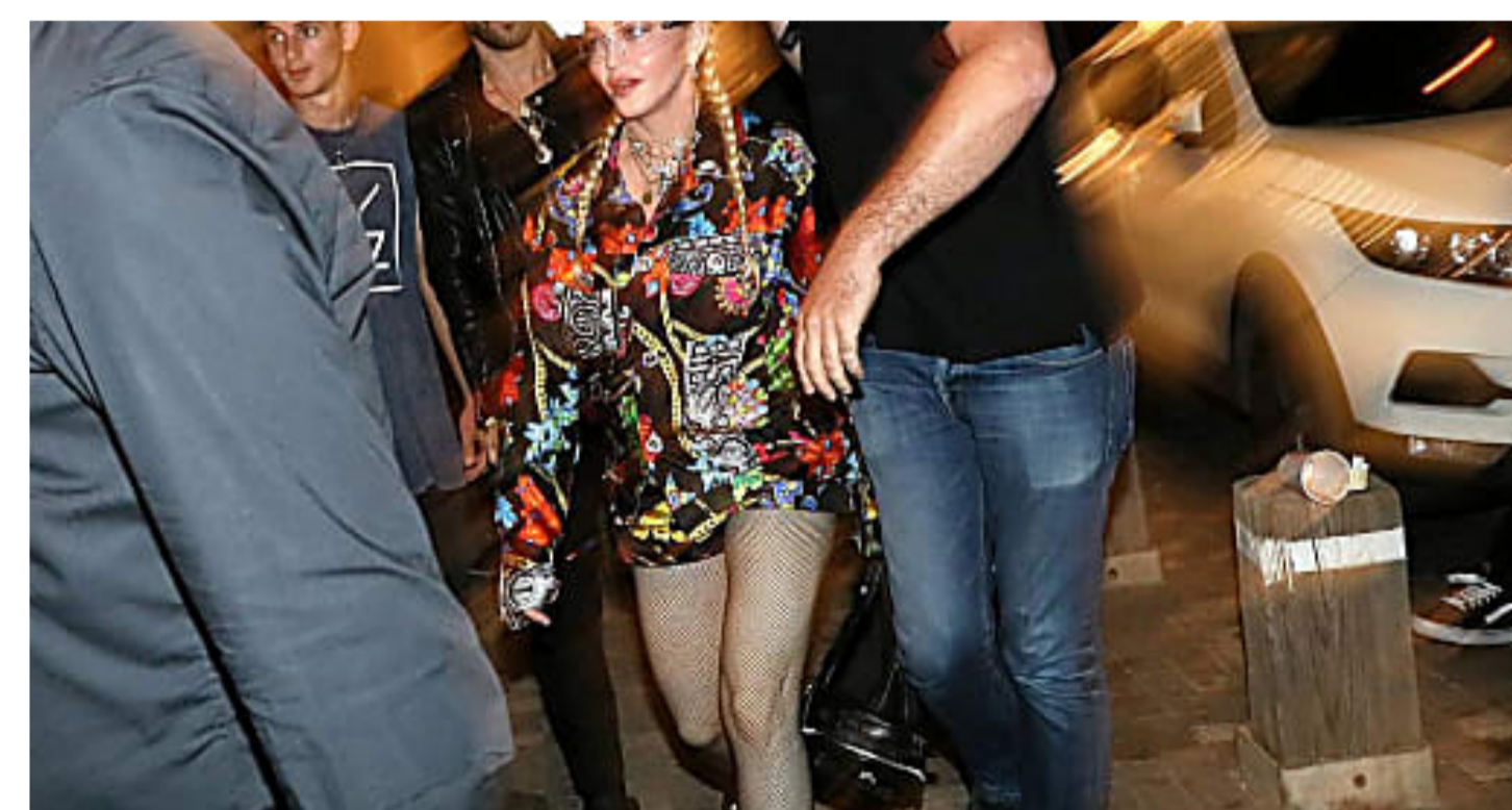
La finale dell'Eurovisione tra polemiche e boicottaggi Euronews

"Colpa di Salvini" arriva 8 anni dopo "Tutta colpa di Pisapia" Euronews