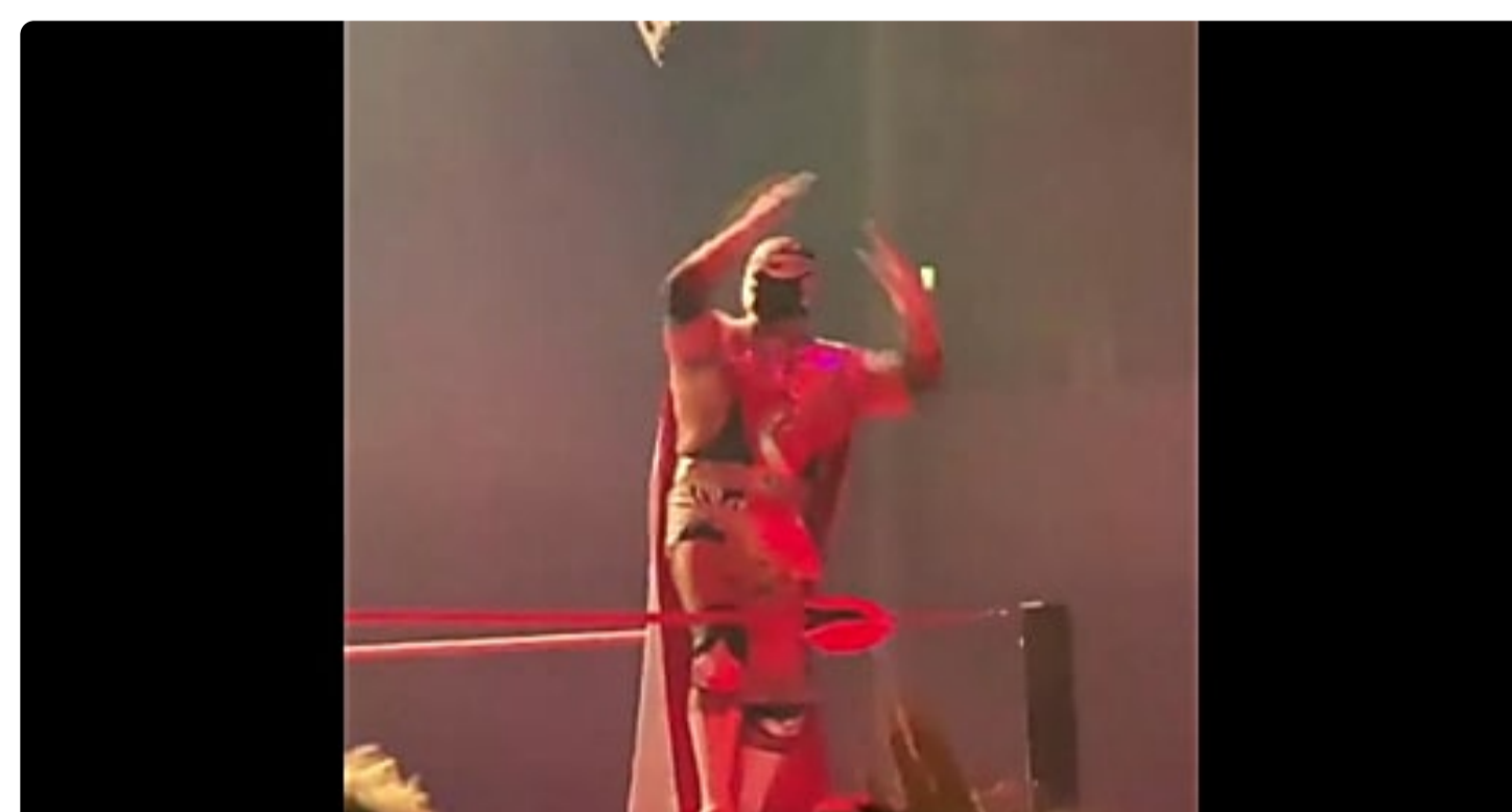
Wrestling: morte in diretta sul ring Euronews