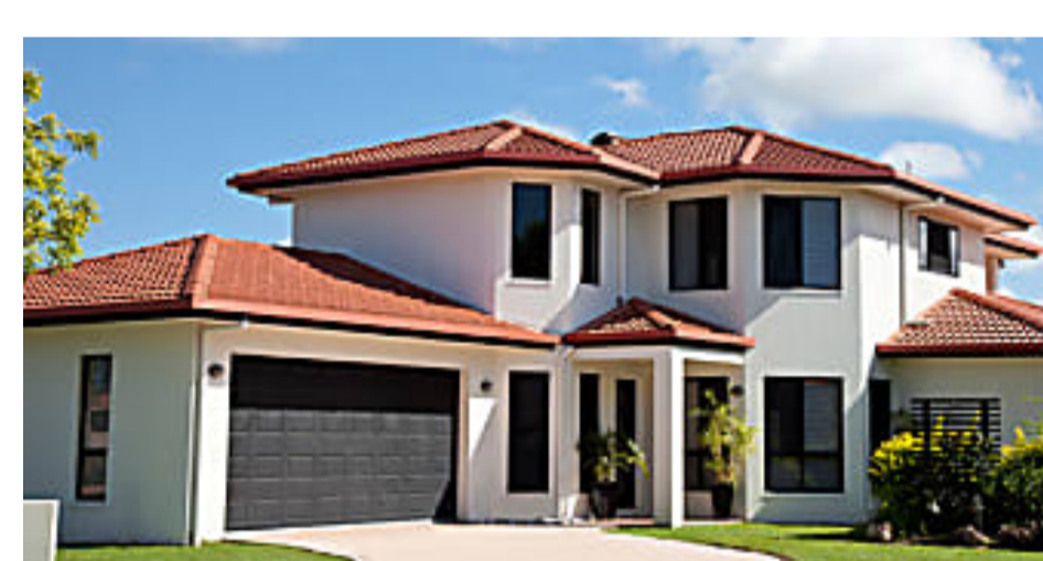
Tecnologia leader per copertura completa di tutta la casa. Promo... Antifurto Verisure