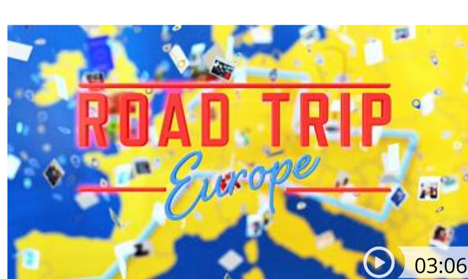
ITALIA Road Trip: tappa alla Certosa di Trisulti, "l'accademia sovranista"