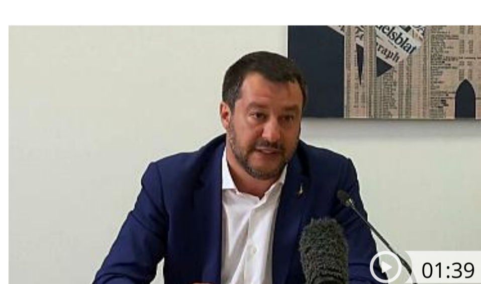
ITALIA Salvini: "Sono più europeista degli europeisti"